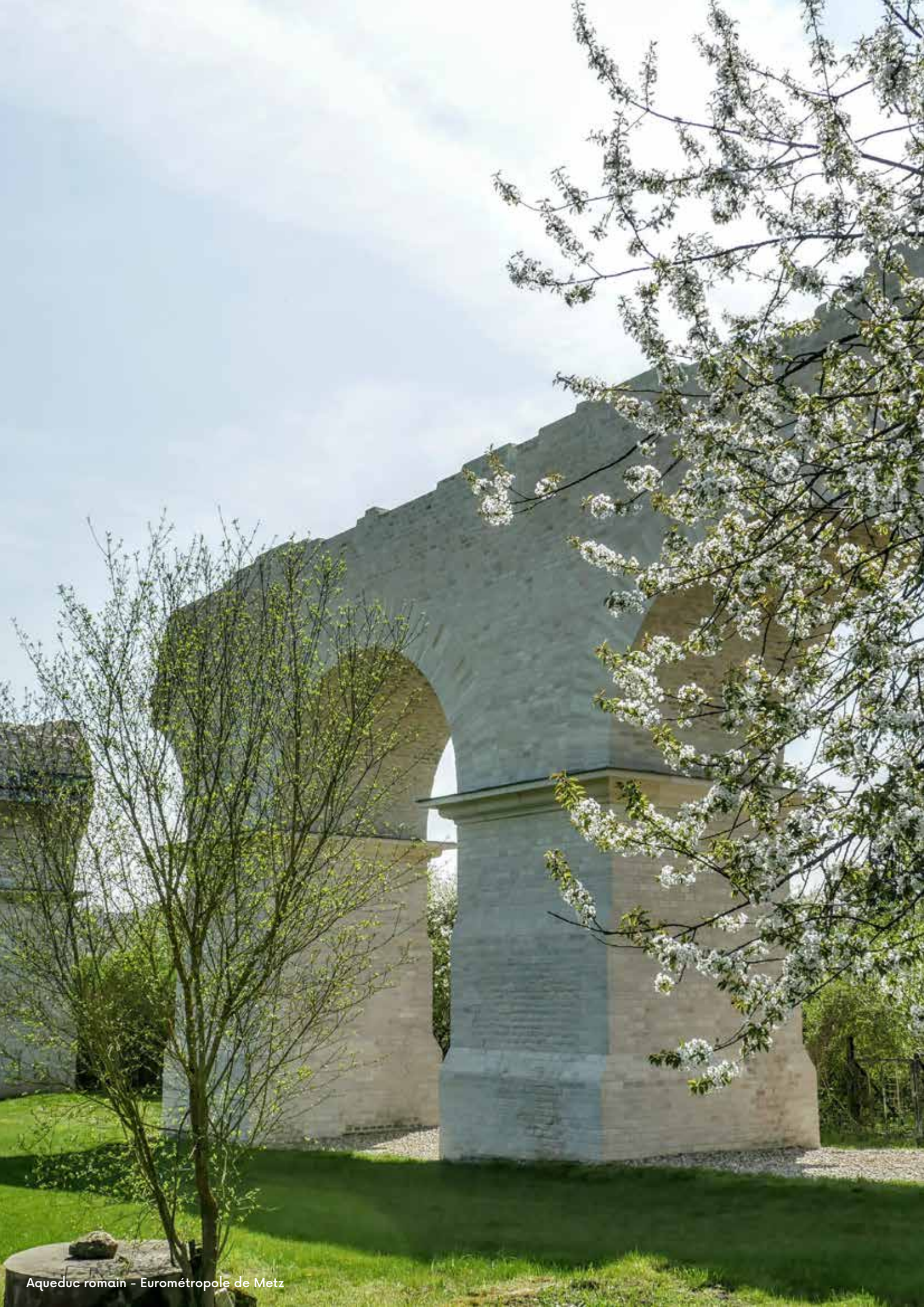
Aqueduc romain - Eurométropole de Metz