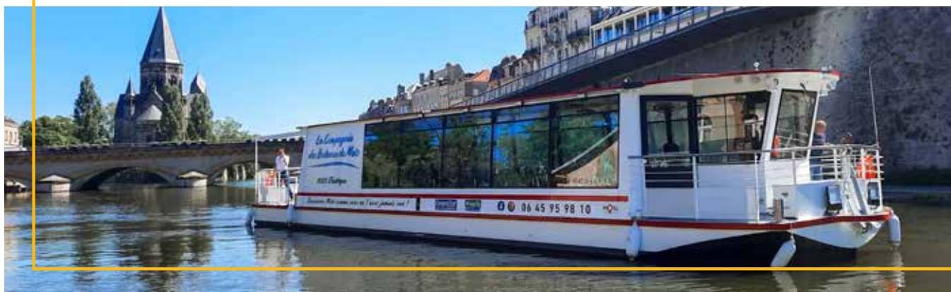
Le Graoully - La Compagnie des Bateaux de Metz

* SUR DEVIS, sous réserve d'augmentation des tarifs de nos partenaires en 2023 (petit train, bateaux).