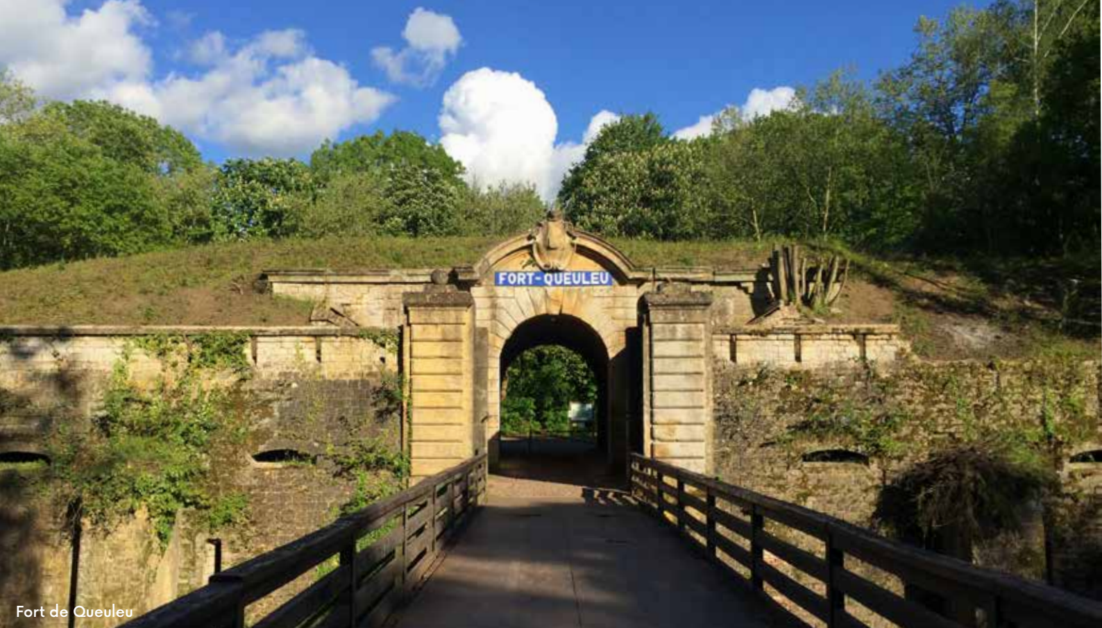
Fort de Queuleu