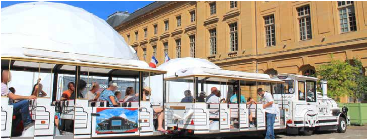
Le P'tit train by Schidler