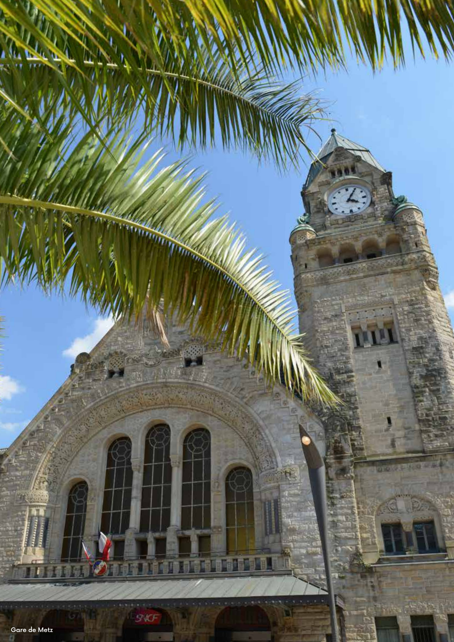
Gare de Metz