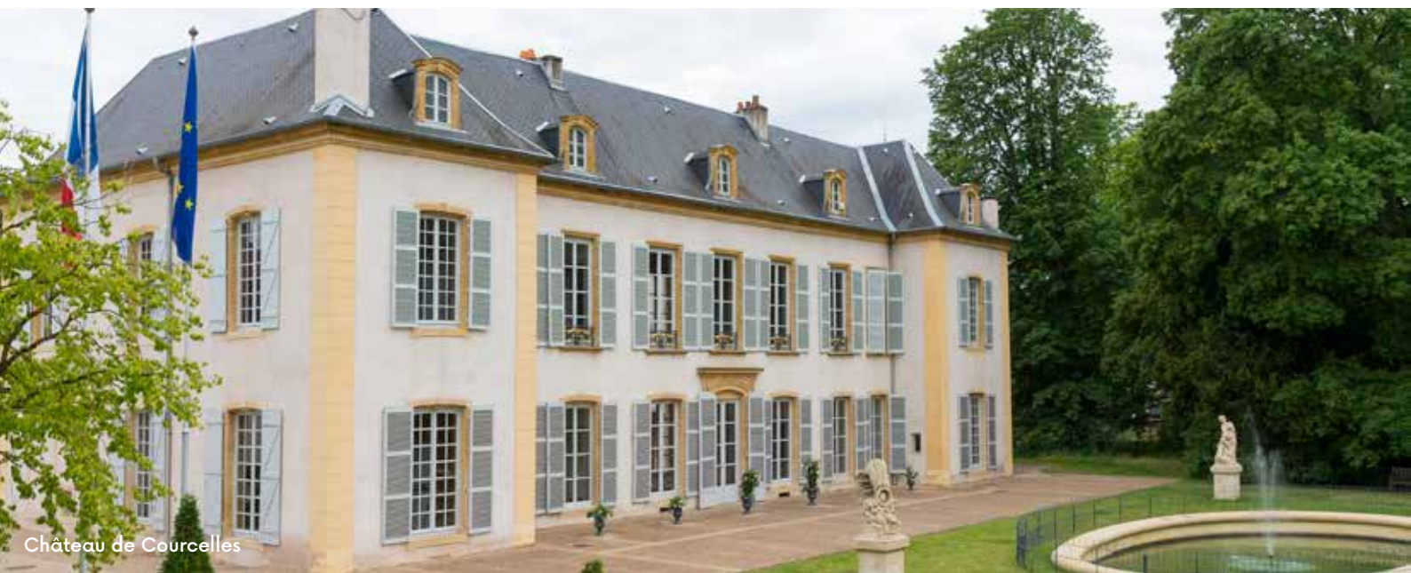
Château de Courcelles